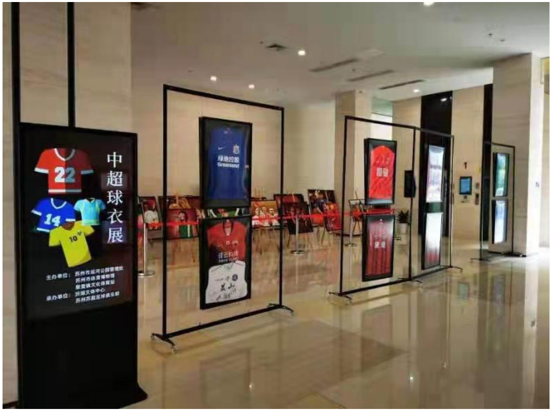
足球球迷油画展、中超球衣展