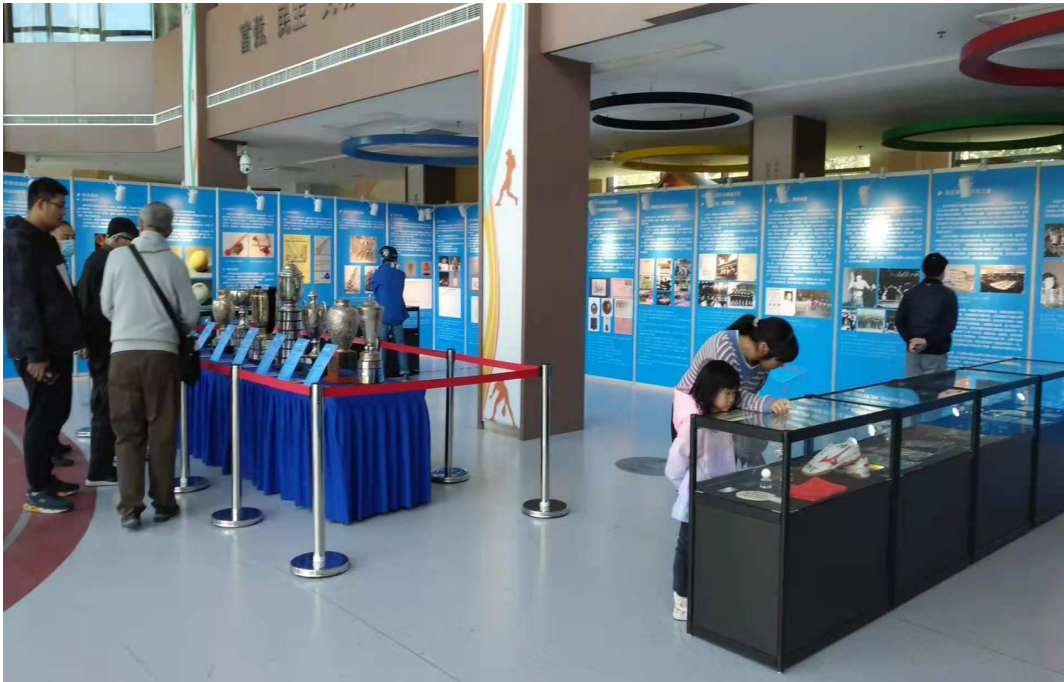
全国乒乓球文化巡展（苏州站）