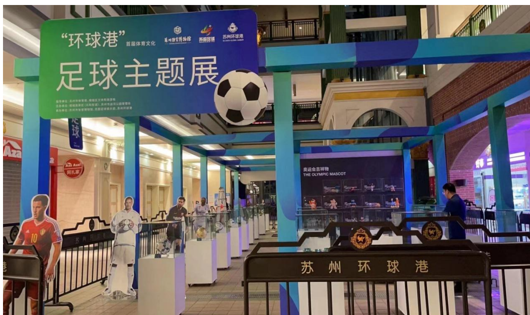
“环球港”首届体育文化展——足球主题展